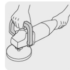
Mango abatible tipo "D"