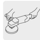
Mango lateral para mayor comodidad y control