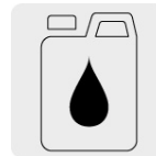
Aceite monogrado SAE30