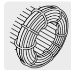
Motor con bobinas de cobre