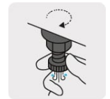
Válvula de drenado