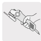
Cuerpo delgado operación a una mano