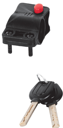
Cable de acero trenzado