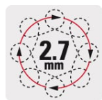
Doble movimiento: elíptico y rotativo