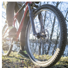
Llantas de bicicletas