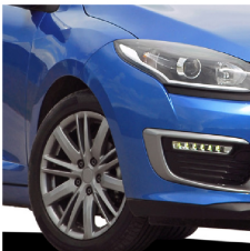
Llantas de automóviles