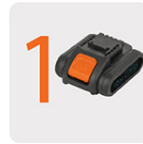
Incluye batería ion litio