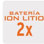
Más tiempo de vida Mayor velocidad de carga