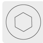
Entrada para llave allen